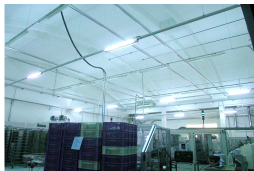
Applicazione in un ambiente industriale

La tecnologia UV-C è un metodo di disinfezione fisico con un ottimo rapporto costi/benefici, è ecologico e, al contrario degli agenti chimici, funziona contro tutti i microrganismi senza creare resistenze.