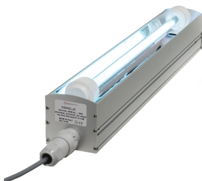
Modello UV-STICK in alluminio