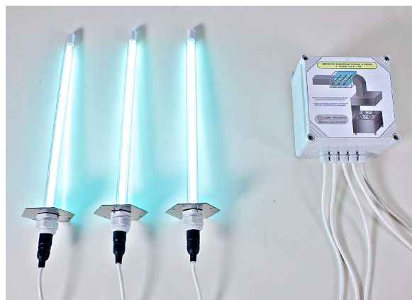
UV-STYLO-S con quadro di controllo