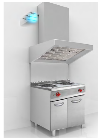
Applicazione in una cucina industriale

La tecnologia UV-C è un metodo di disinfezione fisico con un ottimo rapporto costi/benefici, è ecologico e, al contrario degli agenti chimici, funziona contro tutti i microrganismi senza creare resistenze.