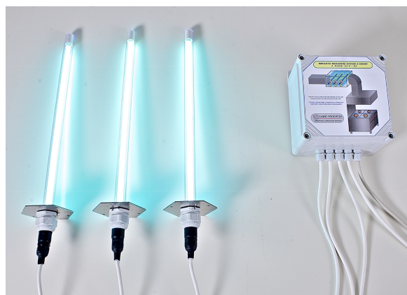
UV-STYLO-S mit Schalttafel