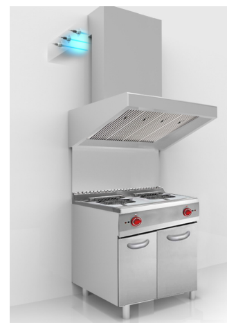
Anwendung in einer Großküche

Die UVGI-Technologie ist eine physikalische Desinfektionsmethode mit einem hohen Kosten-Nutzen-Verhältnis, sie ist ökologisch und wirkt im Gegensatz zu Chemikalien gegen alle Mikroorganismen, ohne Resistenzen zu erzeugen.